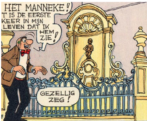
Nero — Marc Sleen