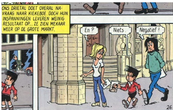
Kiekeboe — Merho