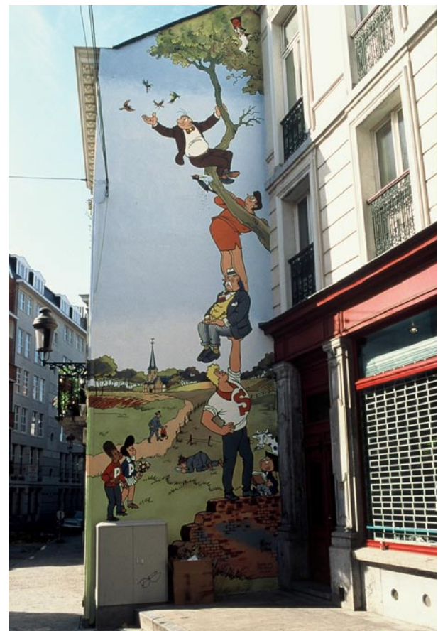
Stripmuur Nero — Marc Sleen

Loop nu rond de hallen en dan kom je aan een klein kronkelend straatje, de Borgwal. Volg dit straatje naar